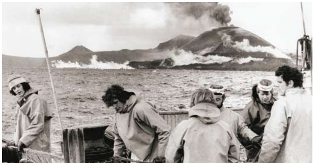
27. apríl 1973. Netin dregin og gýs af fullum krafti nokkur hundruð metra frá.

Hjól atvinnulífsins tóku hægt en taktfast að snúast, bátar fóru í auknum mæli að landa afla sínum í Friðarhöfn og fólkinu fjölgaði sem flutti heim til starfa í Vinnslustöðinni. Það var lán Vestmannaeyinga á þessum umbrotatímum að til var fjöldi fólks úr öllum stéttum sem hafði þrek og þor til þess að takast á við yfirstandandi vá, hafði trú á að Eyjarnar ættu sér framtíð og vann hörðum höndum að uppbyggingu eftir að hamfarirnar voru yfirstaðnar.