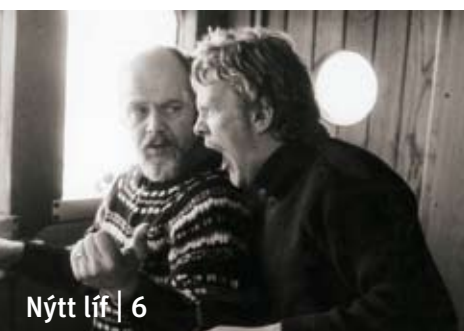
Nýtt líf | 6