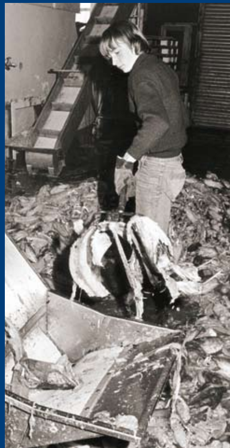
Vinnsla loðýrafóðurs í Vinnslustöðinni! Árið 1983 kom fram hugmynd í stjórn Vinnslustöðvarinnar um að kanna möguleika á því að setja á stofn refabú í Vestmannaeyjum og höfðu menn þá rennt huga til þess að nota fiskmeltu frá stöðinni til fóðrunar. Þessi hugmynd náði ekki að verða að veruleika en loðýrafóður var unnið um hríð hjá fyrirtækinu.

una og gjörbreyta samsetningu skipaflota fyrirtækisins.