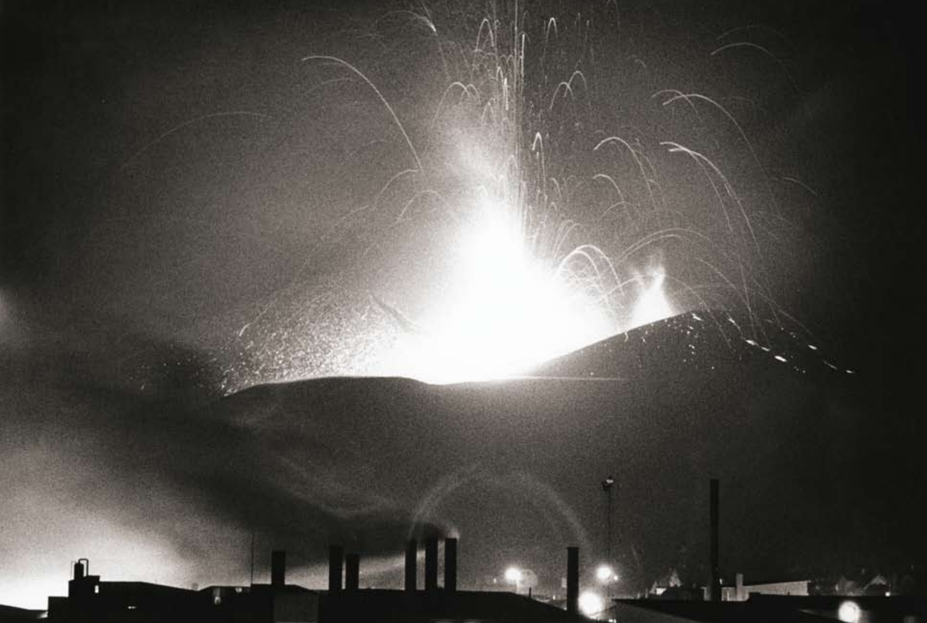
1. mars 1973. Gos í fullum gangi en í forgrunni sést reykur stíga upp frá Fiskimjölsverksmiðjunni. Bræðsla var hafin í Eyjum!